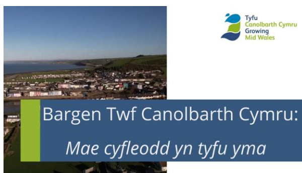
5 - https://youtu.be/tpzsNfYUlii?feature=shared

Mae'r ffilm isod yn tynnu sylw at y rhaglenni a'r prosiectau sy'n cael eu cefnogi gan Fargen Twf Canolbarth Cymru (cliciwch ar y ddelwedd i'w cyfeirio at sianel YouTube Tyfu Canolbarth Cymru):