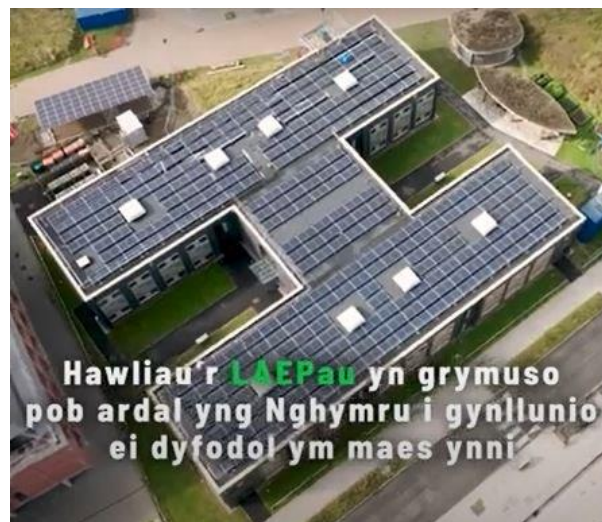
1 - Cynllunio Ynni Ardal Leol yng Nghymru

Mae Llywodraethu Cymru wedi ymrwymo i raglen fawr o gyflwyno Cynlluniau Ynni Ardal Leol , fel y bydd gan bob rhan o Gymru gynllun. Gwylwch y fideo canlynol gan Lywodraeth Cymru sydd yn esbonio Cynlluniau Ynni Ardal Leol yng Nghymru (Cliciwch ar y ddelwedd isod i gael eich cyfeirio at fideo YouTube): https://youtu.be/kUGUMZzrfI4