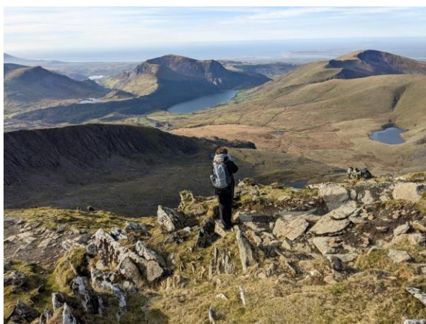
4 - Gemma yn archwilio'r Wyddfa