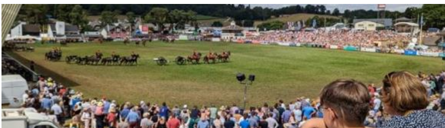
Cylchlythyr Tyfu Canolbarth Cymru

Ym mis Awst 2022, Partneriaeth Sgiliau Rhanbarthol Canolbarth Cymru oedd y prif ffocws cylchlythyr Tyfu Canolbarth Cymru, a defnyddiwyd hyn fel modd i helpu'r gwaith o recriwtio arweinydd busnes yn Gadeirydd newydd Bwrdd y PSRh, a hybu'r Arolwg Cyflogaeth a Sgiliau.